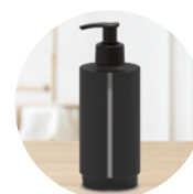
VISIONNEUSE DE NIVEAU